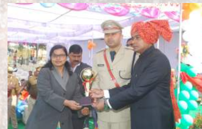
DUDA Baghpat displayed PMAY (U) jhanki on Republic day and won 1st prize