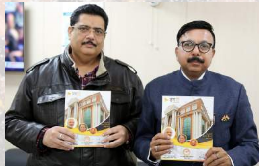
Launching of monthly magazine (PRAGATI) on progress of PMAY (U) in Uttar Pradesh