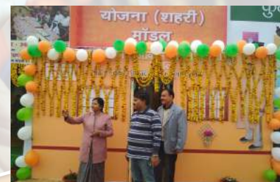
Display of model house at Kumbh 2019, Prayagraj

Through these activities following goals were achieved -